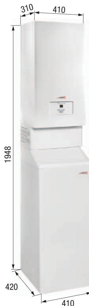
Sestava kotle Ray..K se zásobníkem B60Z umístěným pod kotlem

Ideální řešení pro byty, RD, novostavby i rekonstrukce. Variabilita, stupeň výbavy a spolehlivost jsou největšími přednostmi těchto souprav. Tyto montážní systémy si pro své kompaktní řešení právem získaly řadu spokojených uživatelů.