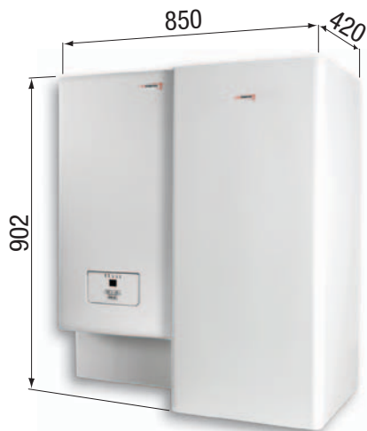
Sestava kotle Ray..K se zásobníkem B60Z umístěným vpravo

Kombinace jednoho zásobníku 60l a různých typů kotlů (6 - 28 kW). V nabídce jsou dvě základní propojovací soupravy, které se liší podle umístění zásobníku B60Z vůči kotli (vpravo či vlevo nebo dole).